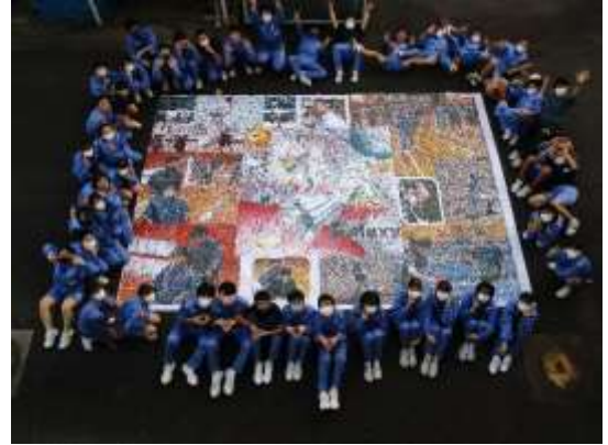
西二中協働のシンボル：全校生で製作した紫苑祭ビッグアート

第3学期の始業式は1月11日（火）です。17日間の冬休みを安全に過ごせるよう、ご家庭におけるご指導をよろしくお願いいたします。