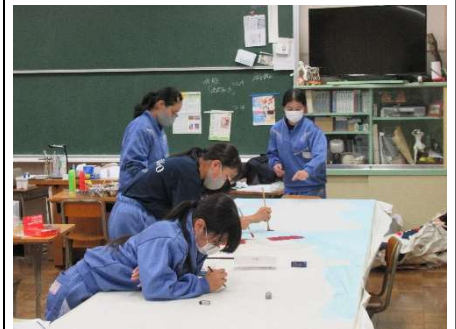
美術部による看板製作の様子