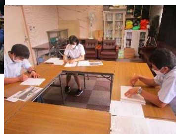
授業後の研究協議会の様子 →